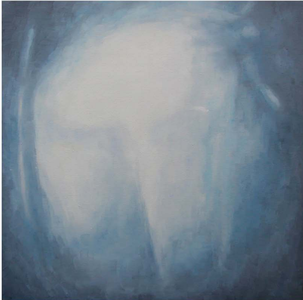
HOLE, 2011 - Óleo sobre lienzo - 70 x 70 cm.