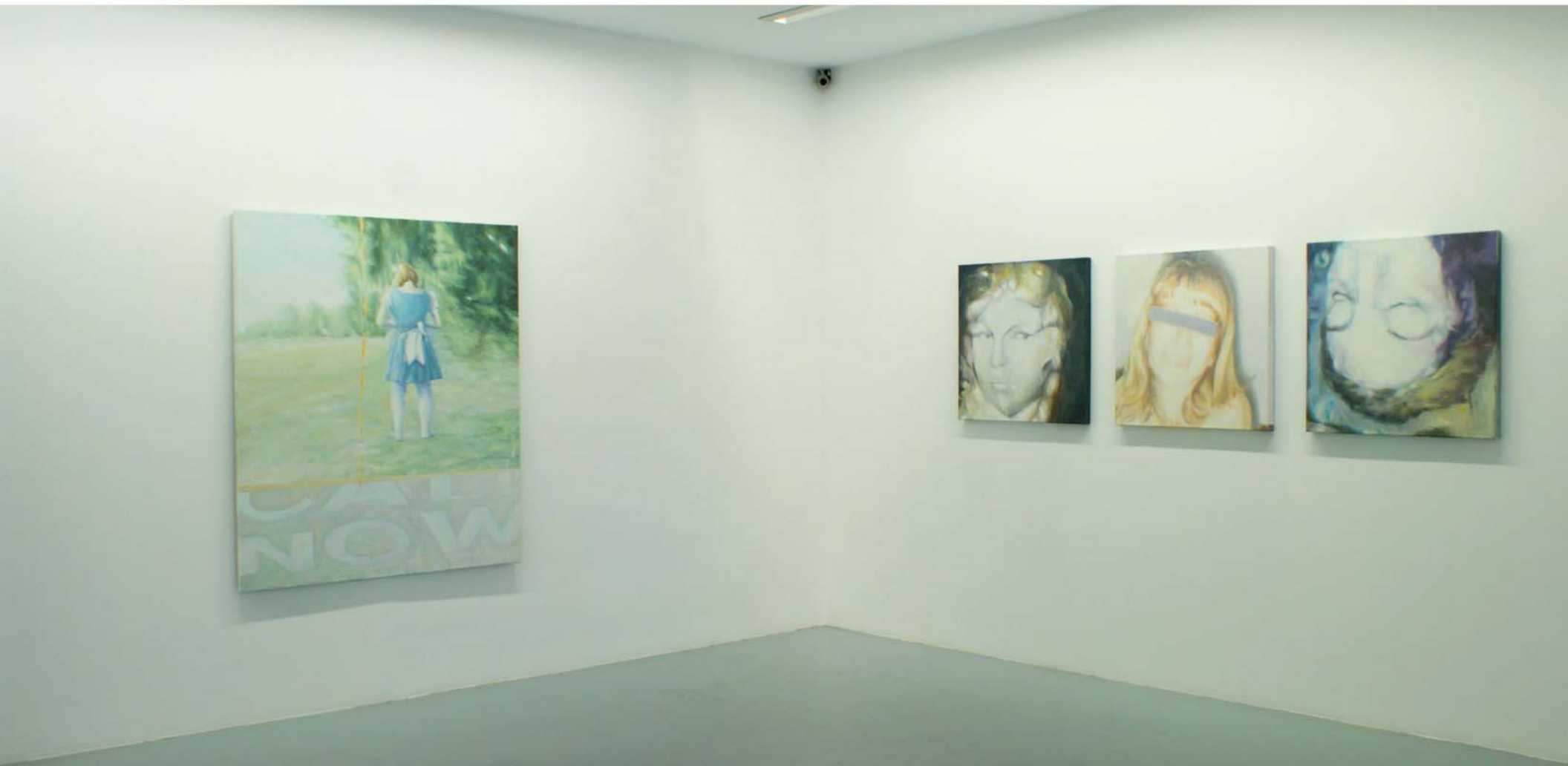
Pg 20.. CALL NOW , 2011 - Óleo sobre lienzo - 140 x 120 cm.