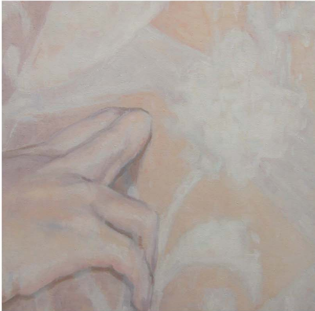
SILKY TARGET, 2011 - Óleo sobre lienzo -70 x 70 cm.