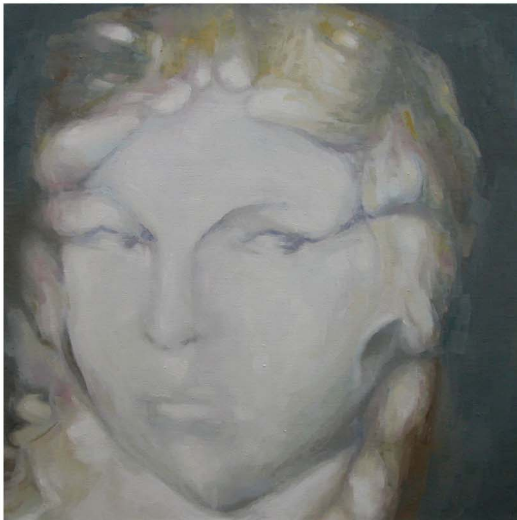
ALICE'S NIGHT CORNER, 2011 - Óleo sobre lienzo - 70 x 70 cm.