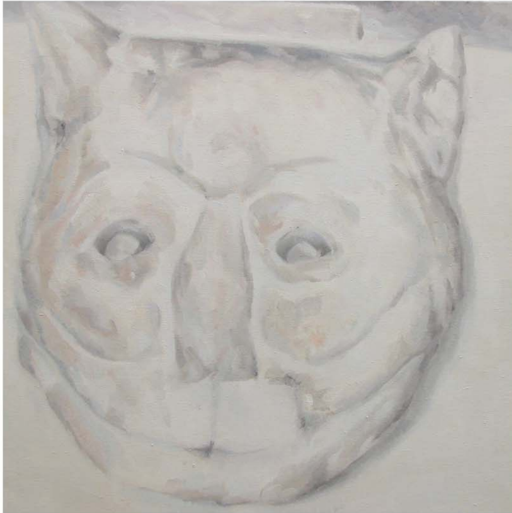
CHESCHIRE CAT, 2011 - Óleo sobre lienzo - 70 x 70 cm.