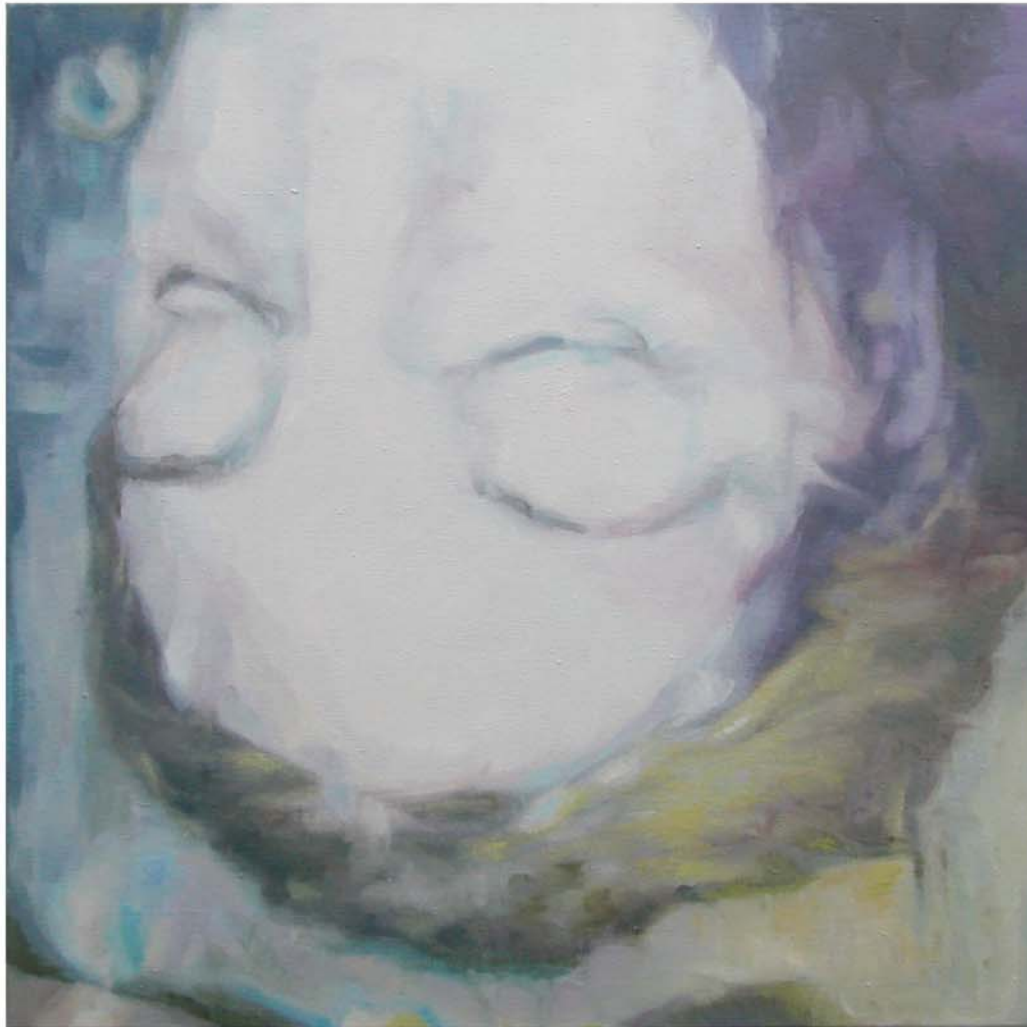
HOLY DEEP BLOW, 2011 - Óleo sobre lienzo - 70 x 70 cm.