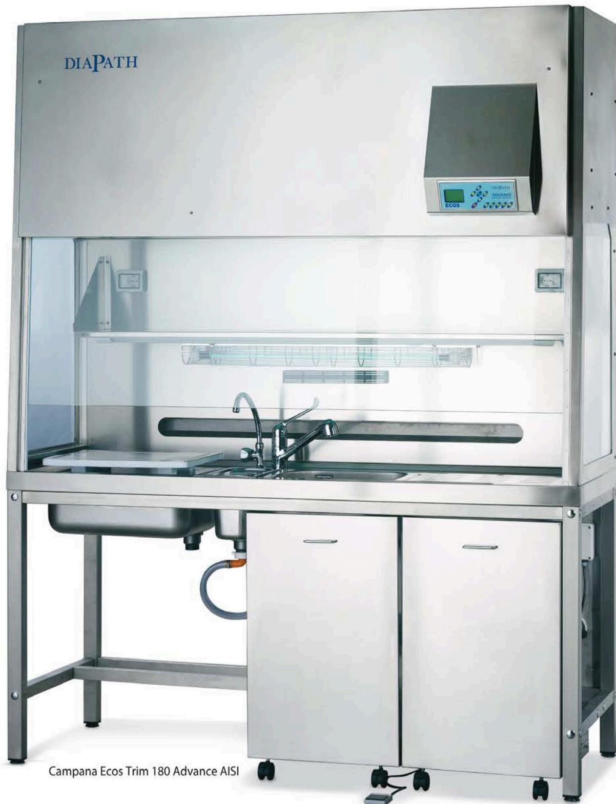
Campana Ecos Trim 180 Advance AISI