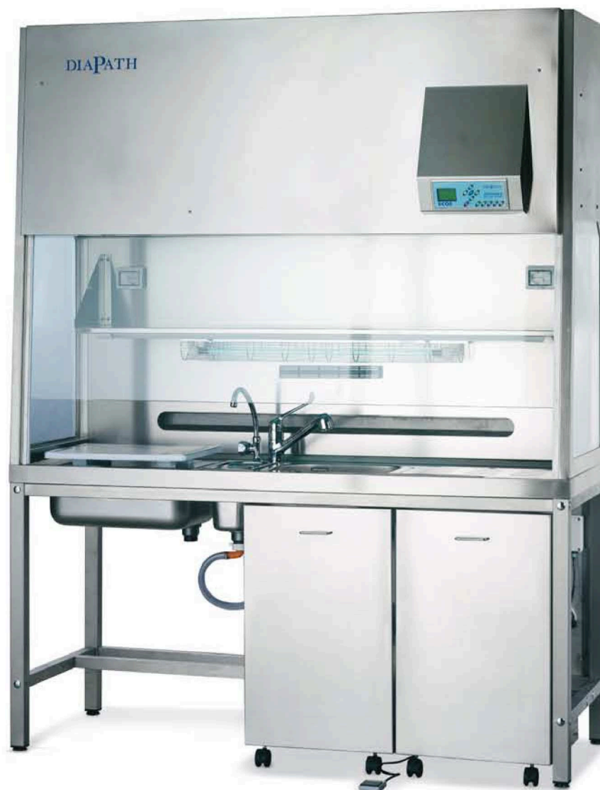
Campana Ecos Trim 180 Advance AISI